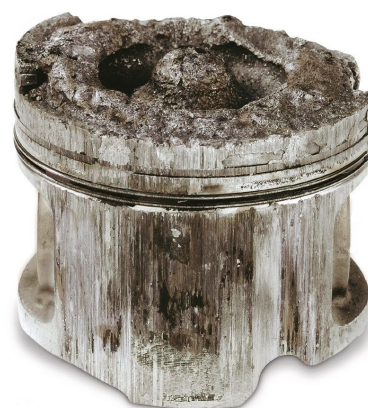
Daño causado por una partícula

¡Conviértase en un especialista en el tema!