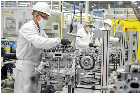
Línea de ensamblaje