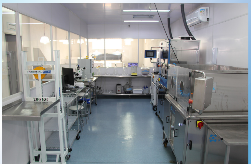
Laboratorio de extracción de partículas con sala limpia – Enge Solutions