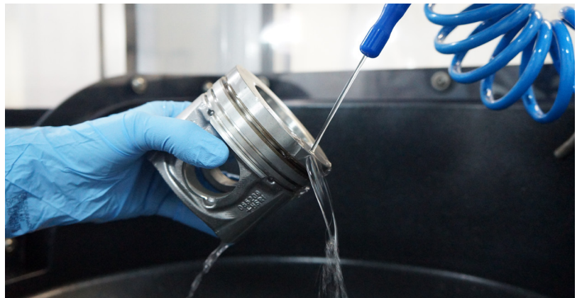
Extracción de partículas con cabina de extracción

Enge Solutions es el único laboratorio con una infraestructura completa para impartir el curso, tanto en su parte teórica como práctica, cumpliendo con todos los requisitos de los clientes y presentando los equipos más modernos para el análisis de contaminación.