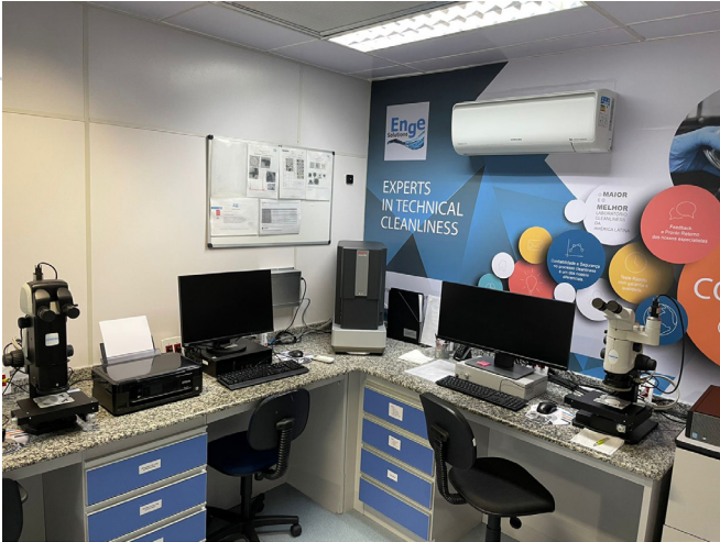
Laboratorio de microscopía – Enge Solutions

Existen numerosos detalles dentro del proceso de análisis que pueden contribuir a errores en los resultados. Un solo error puede generar una serie de complicaciones en cascada dentro del entorno productivo, así como con proveedores y clientes finales.