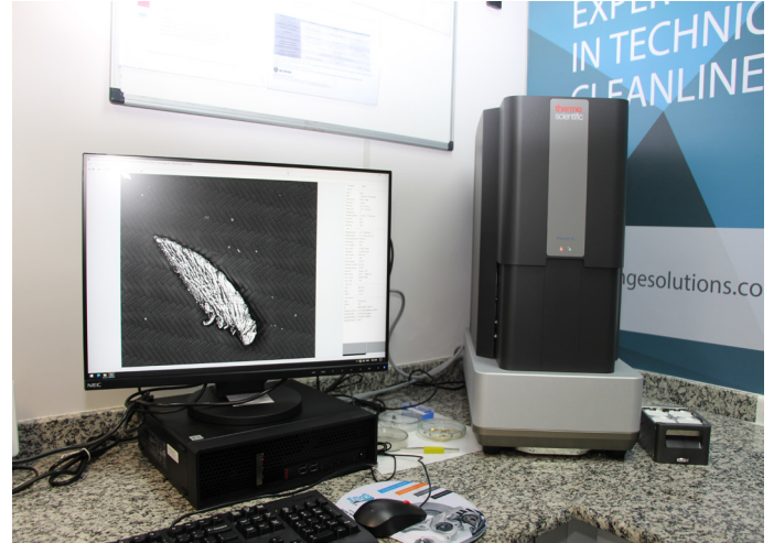
SEM/EDS – Enge Solutions