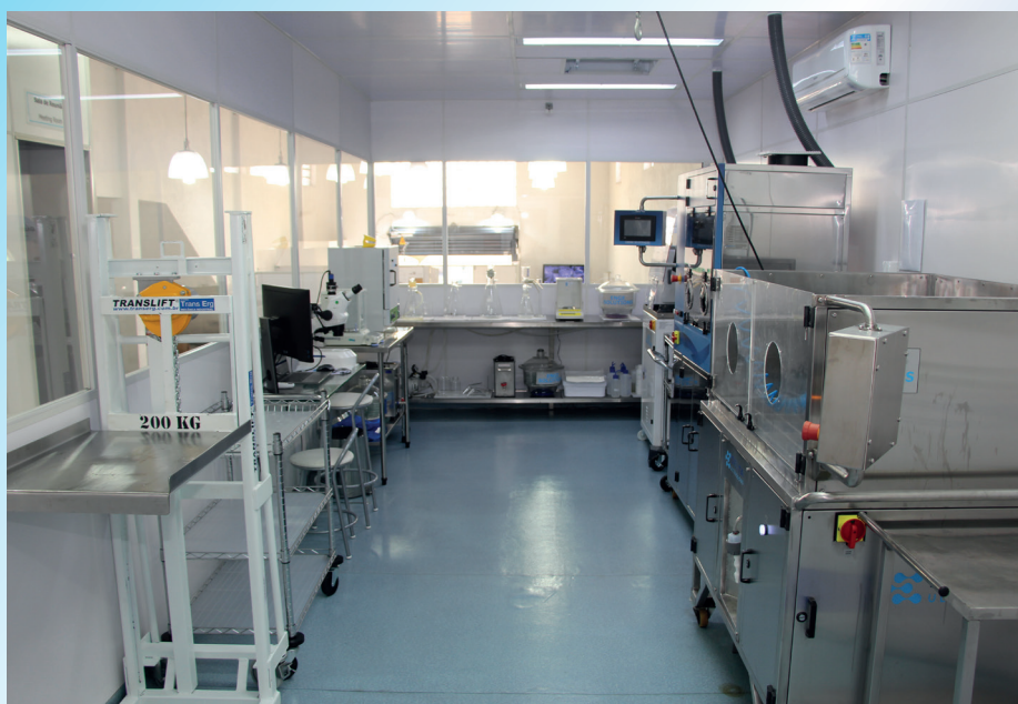
Laboratorio de extracción de partículas con sala limpia – Enge Solutions